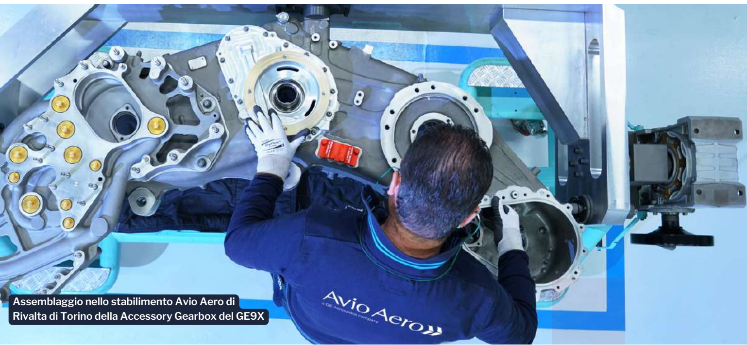
Assemblaggio nello stabilimento Avio Aero di Rivalta di Torino della Accessory Gearbox del GE9X

L'obiettivo di GE Aerospace è far sentire le persone "sempre a loro agio nel sollevare dubbi o esprimere dissenso, sia all'interno delle loro funzioni che attraverso la segnalazione di violazioni di policy tramite il nostro sistema di open reporting". Nel settore aerospaziale, inoltre, la compliance assume una connotazione specifica che va oltre il semplice rispetto delle leggi e dei regolamenti, poiché è strettamente correlata al concetto di sicurezza in un contesto normativo in rapida evoluzione.