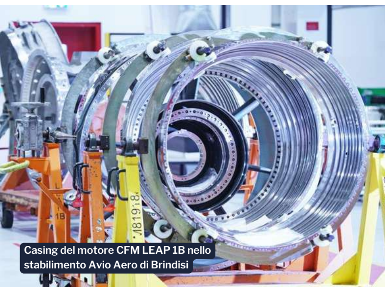
Casing del motore CFM LEAP 1B nello stabilimento Avio Aero di Brindisi

Gli stakeholder, che includono azionisti, clienti, dipendenti e l'opinione pubblica in generale, infatti, "non distinguono i potenziali problemi in base alla localizzazione di origine". Pertanto, semplificare il contesto e concentrarsi sull'identificare "la cosa giusta", seguendo il classico esempio del newspaper test , è la soluzione che permette di superare la diversità degli approcci.