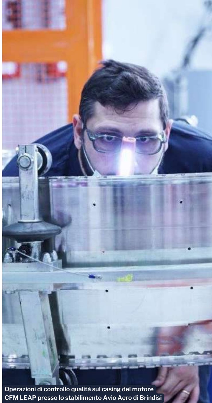
Operazioni di controllo qualità sul casing del motore CFM LEAP presso lo stabilimento Avio Aero di Brindisi

azioni dove esiste un rischio effettivo", spiega Salzotto. Questa tecnologia si basa su due pilastri principali: la capacità di connettere una vasta quantità di dati e la capacità di un tool di apprendere ed interpretare i dati, prevedendo comportamenti futuri.